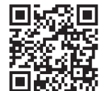
(サービスコード予約サイト)