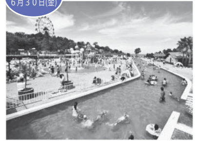
大阪府泉南郡岬町淡輪3990 TEL : 072-492-1005