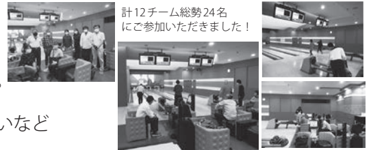
計12チーム総勢24名 にご参加いただきました!

コロナ禍ということもあり、大会の開催が危ぶまれていましたが多くの会員様に参加お申込をいただき、感染症対策を講じながら、無事に開催することができました。お忙しい中ご参加いただいた会員みなさま、ありがとうございました。次回も開催できるよう事務局一同尽力してまいります。またこんなレクリエーションやイベントをやってほしい、参加してみたいなどのご意見、ご要望があれば事務局にお寄せください。