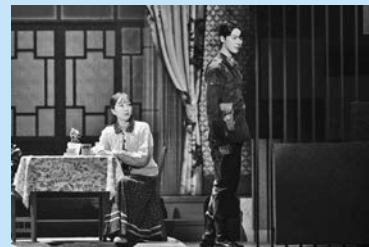
過去舞台写真より

ユ ヨンジェ・後日発表 Wキャスト ジノ<PENTAGON>・KAZUTA<n.SSign> Wキャスト ホギユ・アン セハ Wキャスト ※ Wキャストの出演日は、公式サイトにてご確認ください。