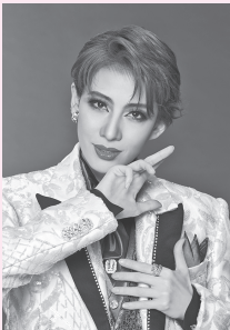
(C) 宝塚歌劇（イメージ）

1月 10日（土）・1月 14日（水） 11時開演 1月 18日（日）16時開演