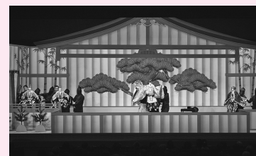
寿式三番叟

第1部／第2部 一般6,500円 ⇒ 4,200円 第3部 一般6,000円 ⇒ 3,800円