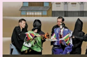
「寿柱立万歳」